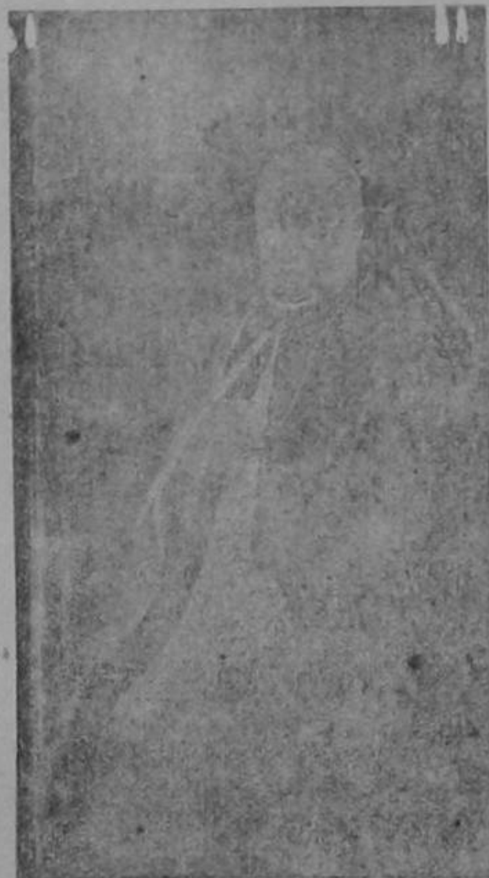
la Patria y para la Religión Católica.

Para Costa Rica fue un placer, una intensa dicha que abriera la puerta de la Internunciatura en Centro América, eslabón de oro que nos acercó más a Roma, y que ha sido una serie de primicias para